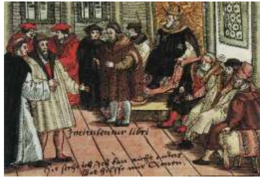
Martin Luther auf dem Reichstag zu Worms

R Luther nahm kein Blatt vor den Mund. Vor E Kardinal Cajetan in Augsburg sollte er 1518 I klein beigegeben, was er mit dem Verweis auf C biblische Aussagen ablehnte. Bei der H Leipziger Disputation, 1519 auf der S Pleißenburg, zweifelte er an, dass es T heilsnotwendig sei, dem Papst zu A gehorchen und dass die Konzilien der Kirche G ohne Irrtum seien. Daraufhin drohte ihm Papst Leo X. schriftlich den Kirchen-