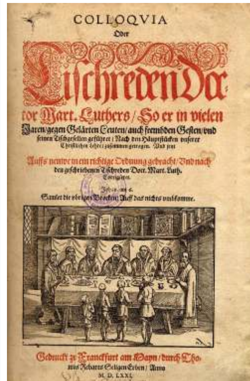
Ausgabe der "Tischreden" - erschienen 1571 in Frankfurt

Unter Verwendung von www.sachsen-lese.de zusammengestellt von M. Sacher